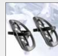
DETTAGLIO POGGIARUOTA WHEEL TRAY DETAILS