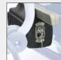
CHIUSURA A CHIAVE KEY LOCK SYSTEM