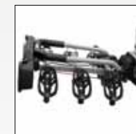
RICHIUDIBILE PER UN FACILE RIMESSAGGIO COMPLETELY CLOSE FOR EASY STORAGE