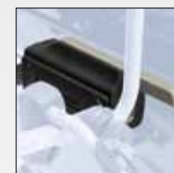
SISTEMA DI AGGANCIO E SGANCIO RAPIDO QUICK-RELEASE SYSTEM