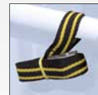
CINGHIA DI SICUREZZA SAFETY STRAP