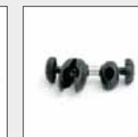
ART. 691/C BRACCETTO ECO IN FERRO ECO STEEL BIKE GRAB ARM