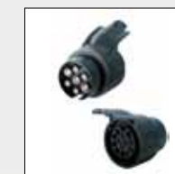
ART. 692 ADATTATORE SPINA 7 POLI + PRESA 13 POLI ADAPTER FROM 7-PIN PLUG TO 13-PIN