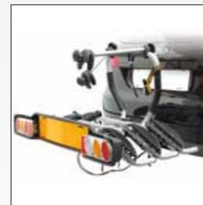
ART. 669/3 SIENA 3 BICI FISSO SIENA 3 BIKES NOT TILT-ABLE