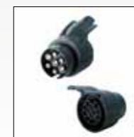
ART. 692 ADATTATORE SPINA 7 POLI + PRESA 13 POLI ADAPTER FROM 7-PIN PLUG TO 13-PIN