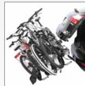
ART. 668/4 SIENA 4 BICI SIENA 4 BIKES