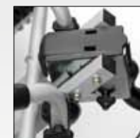
DISPOSITIVO DI INCLINAZIONE INCLINATION DEVICE