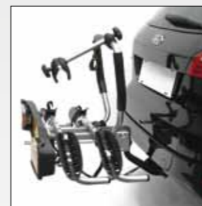
ART. 668 SIENA 2 BICI SIENA 2 BIKES