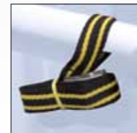
CINGHIA DI SICUREZZA SAFETY STRAP