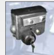
ART. 365 POMELLO ANTIFURTO SECURITY KNOB