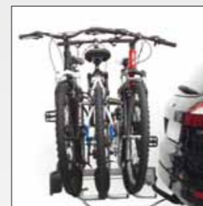
ART. 668/3 SIENA 3 BICI SIENA 3 BIKES